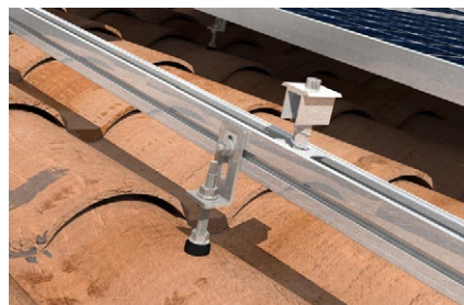
Dettaglio: vite STSR con staffa MW SA