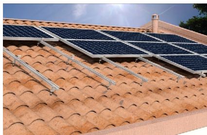
Struttura speciale su copertura a falda