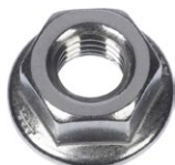
Dado flangiato MU F