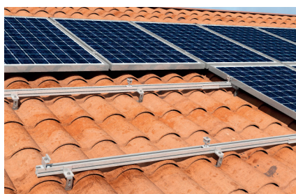
Tetto a falda con tegole