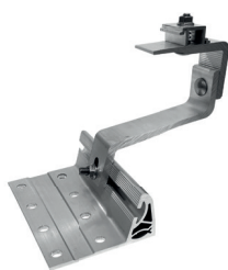
Gancio in alluminio per tegole e listelli GTA3